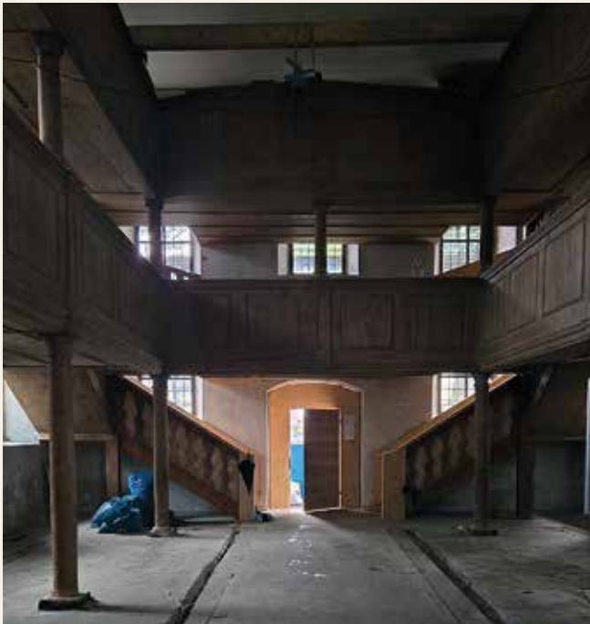
Wenn die Emporen entfernt sind, können die Fenster ihre volle Wirkung entfalten und das „Haus im Haus“ mit Tageslicht versorgen.