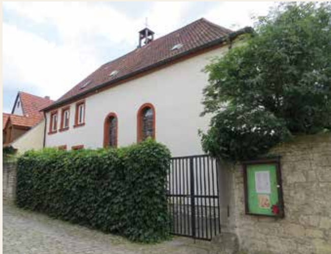
Die Synagoge befindet sich im engen Ortskern von Sommerhausen.

Wie viele Gemeinden in Unterfranken hatte auch Sommerhausen bis zur NS-Zeit eine nennenswerte jüdische Gemeinde. Als bauliches Zeugnis konnte die ehemalige Synagoge die Zeit überdauern, was auch mit der frühen Flucht vieler jüdischer Mitbürger vor den Nationalsozialisten zusammenhängt.