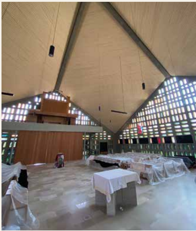
Es ist alles für die Wiedereröffnung von St. Augustin vorbereitet.

Weigand bedankte sich bei den Gastgebern: „Derartige schmerzvolle Abwägungsprozesse werden bei weiterhin abnehmenden Mitgliederzahlen überall in Bayern bei beiden großen Konfessionen kommen. In Ingolstadt ist das von meiner Warte betrachtet gut gelungen. Allerdings ist es in Städten immer leichter, gute Lösungen zu finden, als auf dem Land. Hier ist auch die Politik gefordert. Die Staatsregierung darf die Pfarreien, die Gläubigen und die Diözesen nicht alleine lassen.“