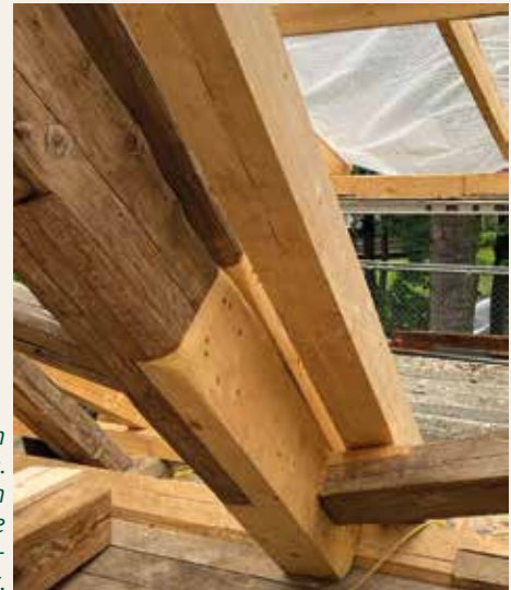
Handwerkskunst in der Denkmalpflege. Soviel wie möglich wird erhalten, neue Balken werden exakt angestückelt.