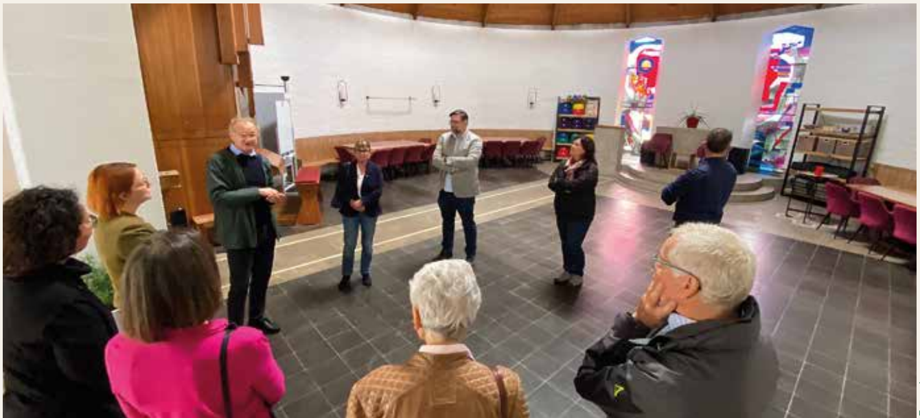
Zentrale Elemente der ehemaligen Kirche sind klar erkennbar.