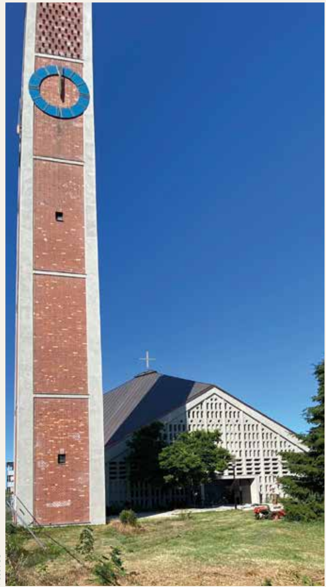
St. Augustin ist als moderne Nachkriegskirche denkmalgeschützt.