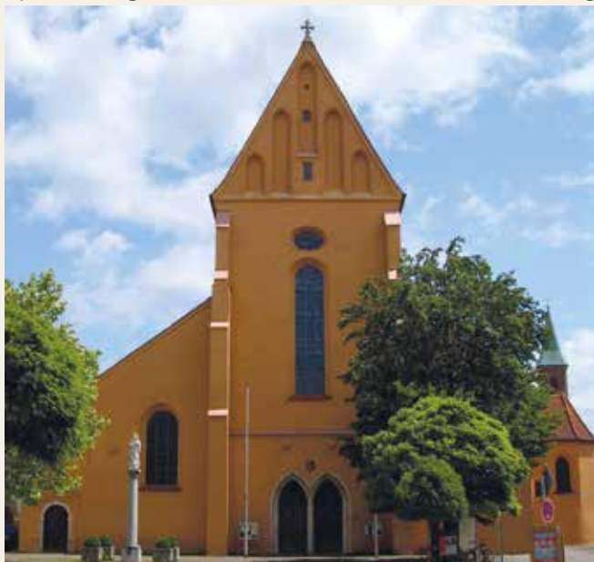
Die Franziskanerkirche ist bei den Ingolstädter*innen sehr beliebt.