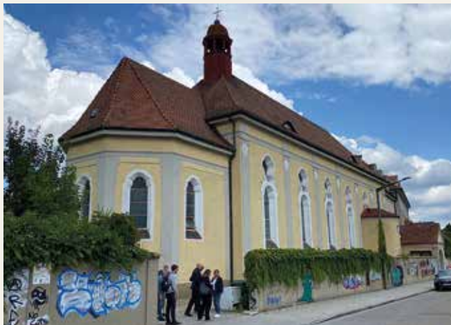
Die Zukunft von St. Fidelis ist derzeit noch ungewiss.