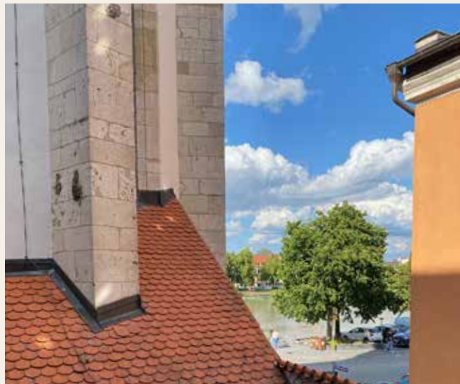
Barocke Prachtentfaltung in der evangelischen Kirche St. Oswald.